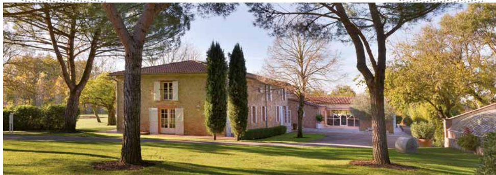
Siège de la Fondation Pierre Fabre à Lavaur (Tarn)

Pierre Fabre, décédé en 2013, avait fait de la Fondation qui porte son nom son légataire universel. Il a donc légué à celle-ci son patrimoine et notamment toutes les actions de son groupe. Les Laboratoires Pierre Fabre sont ainsi devenus le seul groupe industriel français détenu par une fondation d'utilité publique qui avait été créée en 1999 afin d'améliorer l'accès aux médicaments et aux soins de qualité dans les pays les moins favorisés. Au-delà de ses missions propres, la Fondation Pierre Fabre assure donc un rôle déterminant pour l'indépendance et la stabilité du capital du groupe Pierre Fabre qu'elle détient à 86%. Cependant, si la Fondation est l'instance qui détient la majorité du capital de l'entreprise, elle ne s'implique